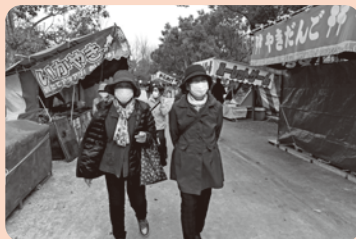
令和6年3月28日 富吉七福会 ~花見と米子駅へお出かけ~