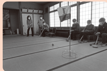
令和6年4月8日 樽屋七福会 ~室内グラウンドゴルフ~