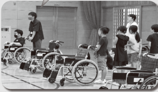
車椅子介助のポイントと注意点を話します