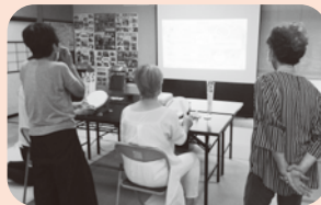
9月15日 海川七福会 ~講師を招いてeスポーツ~