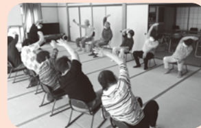
9月25日 下口七福会 ~講師を招いて健康体操~