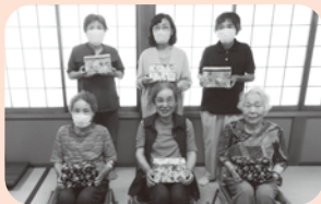
9月11日 樽屋七福会 ~マスクボックスづくり~